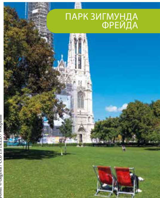
ПАРК СИГМУНДА ФРЕЙДА

мой и Фестиваль музыкальных фильмов летом.