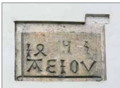
▲ А.Е.И.О.У. – символ императора Фридриха III на крепости Граца.