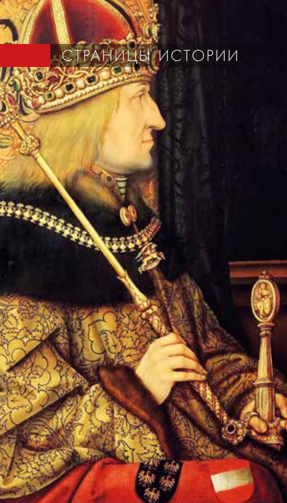
▲ Император Фридрих III.