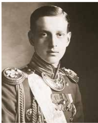
▲ Великий князь Дмитрий Павлович.

После убийства Распутина, в котором Дмитрий Павлович принимал непосредственное участие, он был арестован по личному приказу императрицы, что возмутило сочувствовавший заговорщикам столичный мир. Такой приказ имел право отдавать только сам император. В результате общественных волнений тюремное заключение великому князю заменили ссылкой в Персию, где шла война. Возможно, это спас-