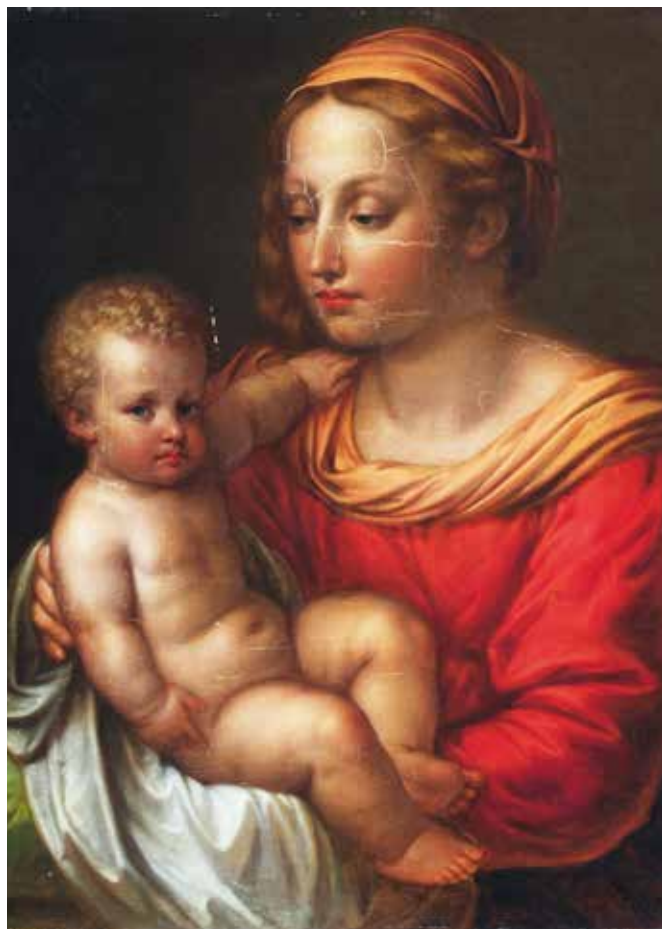
▲ «Мадонна с младенцем» (1816).