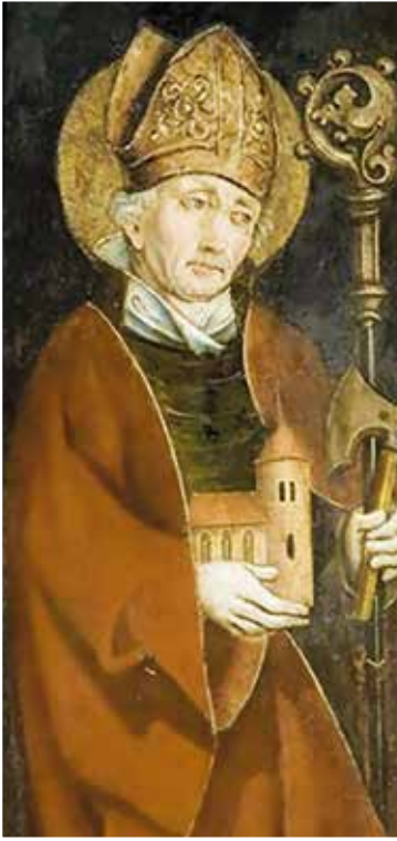
▲ СВЯТОЙ ВОЛЬФГАНГ.