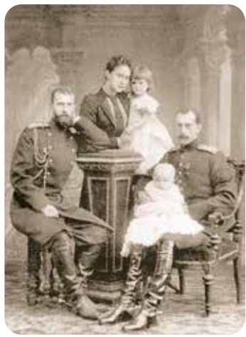
▲ Великий князь Павел Александрович с сыном Дмитрием (на руках), дочерью Марией и приемными родителями своих детей.

Мария и Дмитрий всегда были очень дружны, начиная с раннего детства, лишённого материнской заботы. Они сохранили эти нежные отношения до конца своих жизней, которые сложились странно, сложно и, порой, болезненно, но, безусловно, весьма интересно для любителей приключенческих мемуаров.