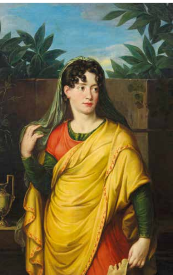
▲ «Актриса Тереза фон Худелист» (1811).