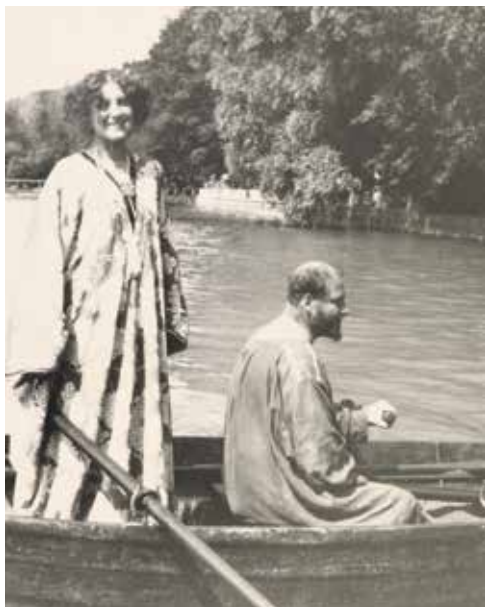
▲ Густав Климт и Эмилия Флэге в лодке на озере Аттерзее. 1909 г.