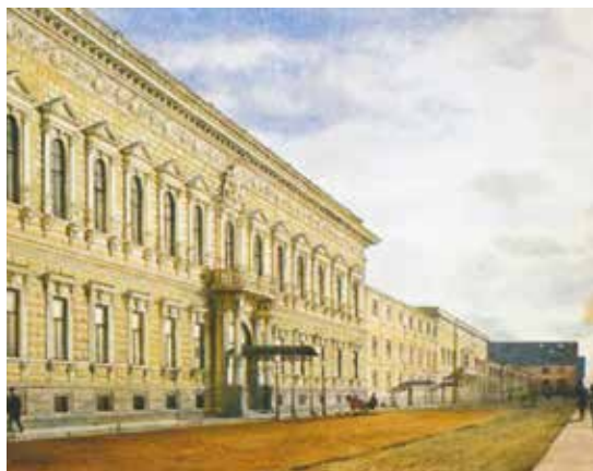
▲ Дворец Павла Александровича в Санкт-Петербурге.