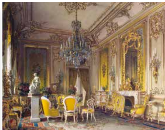
▲ Интерьер дворца Павла Александровича.