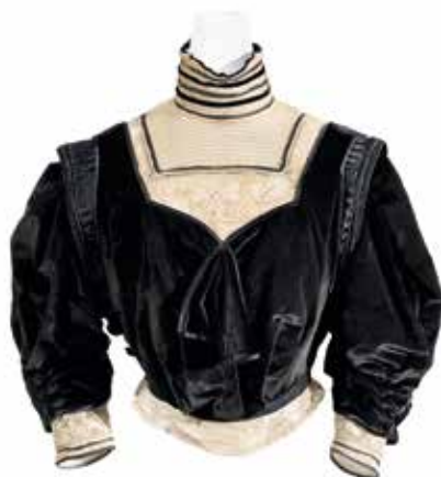
▲ Женский наряд из модного салона «Сестры Флэге». Ок. 1905 г.

Не все венские дамы, которые периодически позировали Климту для портретов, отваживались при-