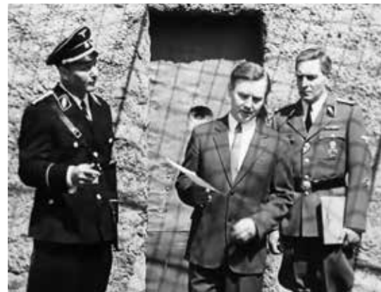
▲ Кадр из фильма «Семнадцать мгновений весны».

Это тоже правда – достаточно зайти в венский Арсенал и посмотреть экспозицию, посвященную временам третьего рейха. Форма действительно выглядит не так геральдически и элегантно, как в киноленте. Но вернемся на пару абзацев назад и вспомним, что у жизни свои законы, а у искусства – свои. Парадная форма выглядела явно киногеничнее и как нельзя лучше подошла для решения той самой творческой задачи, которую поставила перед собой Татьяна Лиознова. Она блестяще вписалась в черно-белое цветовое решение картины, которое, в свою очередь, было продиктовано необходимостью осуществлять вставки из документальных ки-