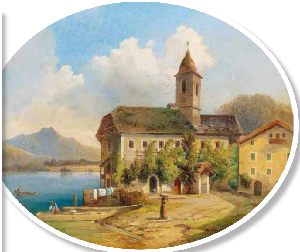
▲ ВИД НА САНКТ-ВОЛЬФГАНГ. ЭДМУНД МАЛЬКНЕХТ.