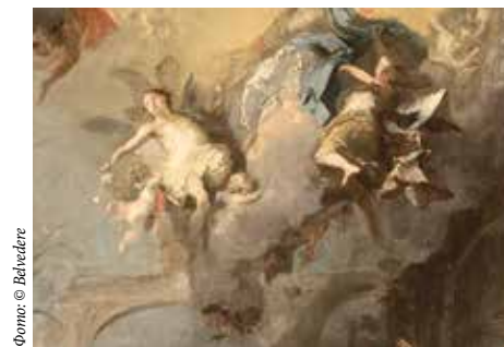
Фомас

В католической среде всегда было принято считать, что Богородица после смерти была погребена в Гефсимании – там, где уже покоились ее родители Иоаким и Анна , а также ее обрученный супруг Иосиф . А через некоторое время Фома (тот апостол, который поначалу не верил в воскресение Иисуса) рассказал другим ученикам Христа о том, что видел, как Мария вознеслась на небо. В доказательство своих слов он привел остальных ко гробу Богородицы и попросил его открыть. Когда же апостолы исполнили просьбу Фомы, то оказалось, что тела Марии в гробу нет, а на его месте лежит множество необыкновенно красивых живых цветов.