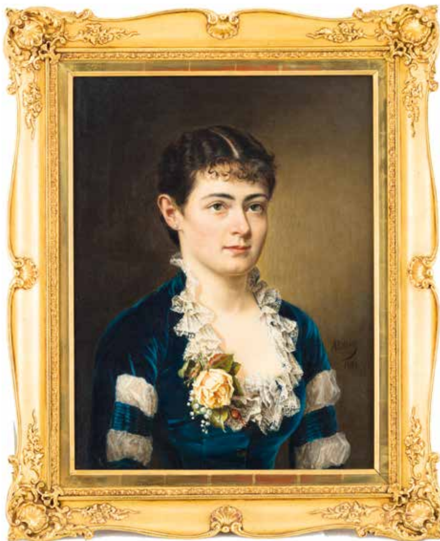
Фото: Adrienne von Pötting (Künstlerin), Unbekannte Dame, 1881, Wien Museum Inv.-Nr. 93539, CC BY 4.0 Foto: TimTom/L.Hilzensauer, Wien Museum ( https://sammlung.wienmuseum.at/objekt/33124/ )