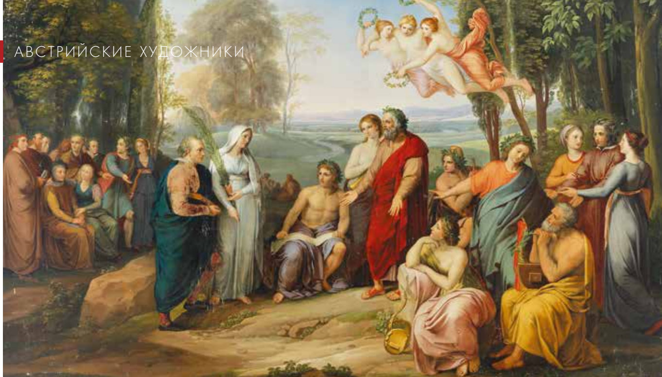
▲ «Прием Клопштока в Элизиуме» (1803 / 1807).