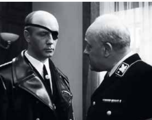
▲ Кадр из фильма «Семнадцать мгновений весны».