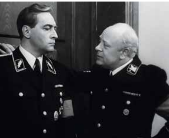
▲ Кадр из фильма «Семнадцать мгновений весны».