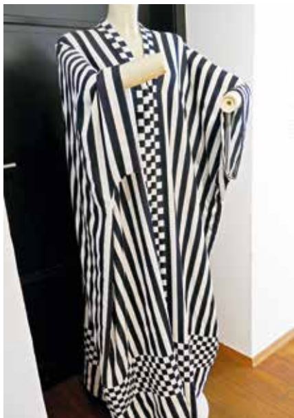
▲ «Реформенное» платье Эмили Флэге.