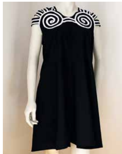
▲ Купальное платье, принадлежавшее Эмили Флэге, дизайн: модный салон «Сестры Флэге». Ок. 1910 г.

Фото: Wien Museum Inv.-Nr. 157541, CC0 ( https://sammlung.wienmuseum.at/objekt/305884/ )