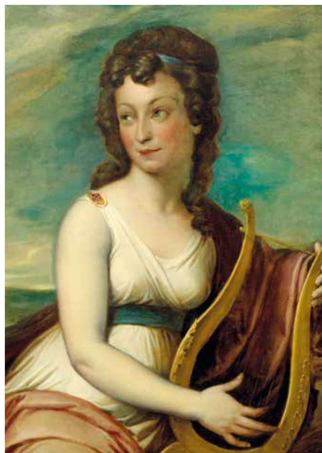
▲ « Мария Леопольдина Пахлер, урожденная Кошак – пианистка, композитор » (1827).