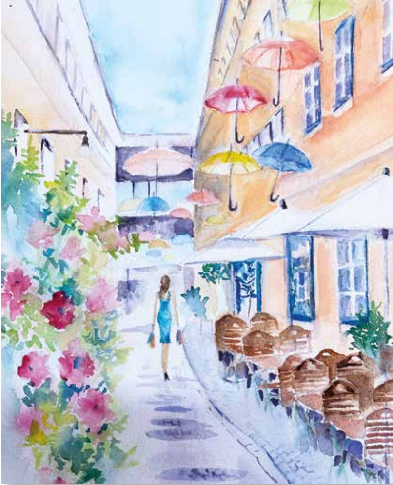
▲ Зюннхоф, акварель, 21 x 30 см. Виктория Малышева