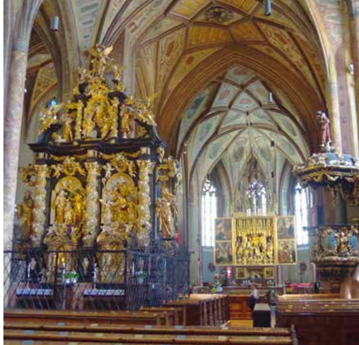
▲ АЛТАРЬ ПАХНЕРА (правее) И АЛТАРЬ ШВАНТАЛЕРА (слева).