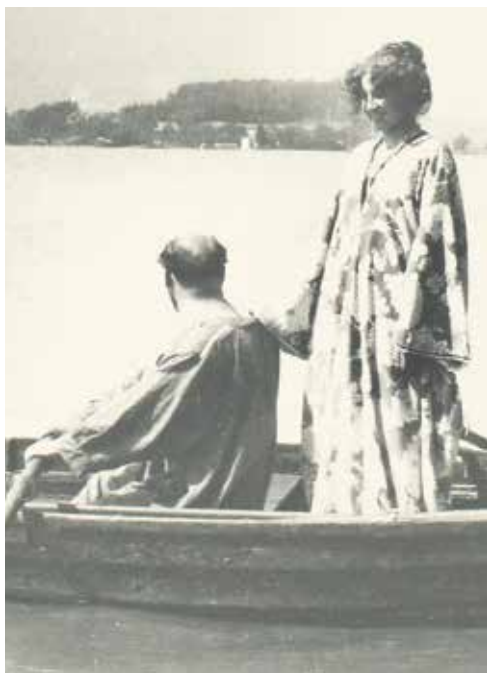
▲ Густав Климт и Эмилия Флэге на озере Аттерзее. 1909 г.

Фото: Unbekannt (Fotograf), Gustav Klimt (1862-1918) und Emilie Flöge (1874-1952) in einem Boot auf dem Attersee (Reproduktion), 1909, Wien Museum Inv.-Nr. 157539, CC0 ( https://sammlung.wienmuseum.at/objekt/305878/ )