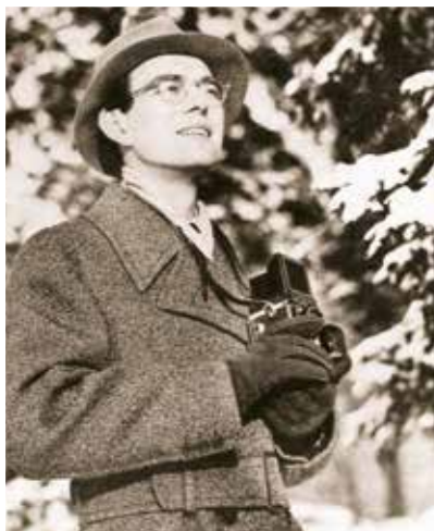
◀ Леннарт Бернадот (1939).