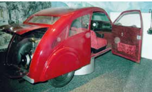
▲ Porsche Type 12 (1932 г.), реконструкция автомобиля.