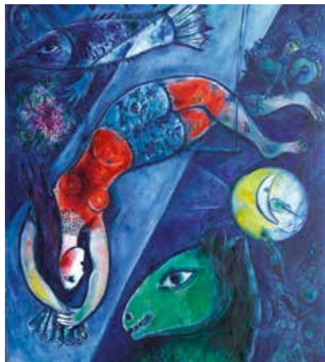
© Centre Pompidou, Paris, Musée national d'art moderne - Centre de création industrielle, édité en 1988, en dépôt au Musée national Marc Chagall, Nizza © Bildrecht, Wien 2024