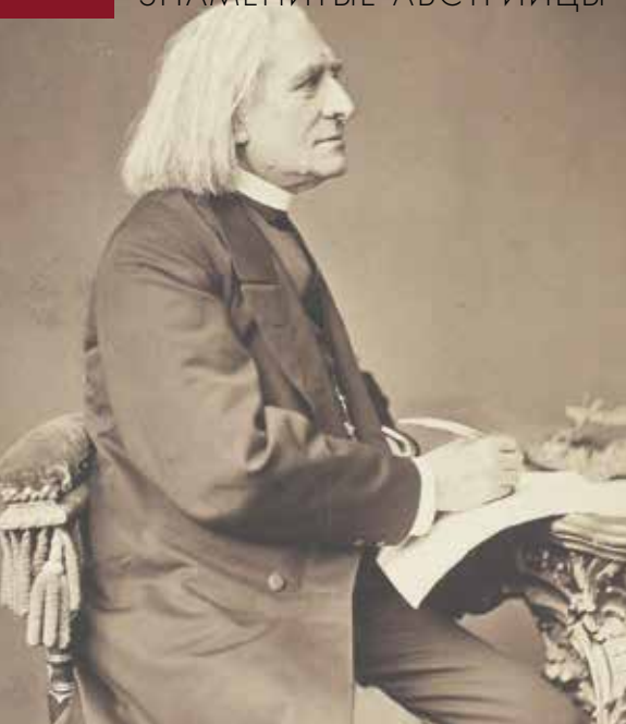
▲ Франц Лист. Ок. 1880 г.

Фото: Ferencz Kozmata (Fotograf), Franz Liszt (1811-1886), Komponist, Pianist, Dirigent (signiert), um 1880, Wien Museum Inv.-Nr. 60316/70, CC0 ( https://sammlung.wienmuseum.at/objekt/473035/ )