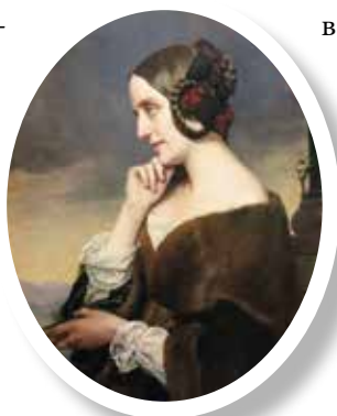
▲ Мари д'Агу.

А Лист, вдохновленный патриотическим подъемом венгерского народа, стал его ярким выразителем в музыке. На его концерты венгерская аристократия приходила в национальных костюмах. Именно там начало зарождаться освобождение Венгрии от имперского гнета династии Габсбургов.