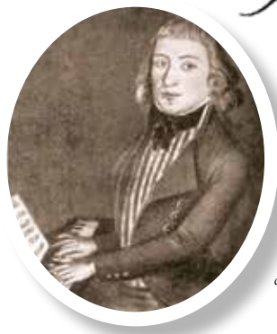
◀ Адам Лист – венгерский государственный служащий, музыкант и отец композитора и пианиста Франца Листа.