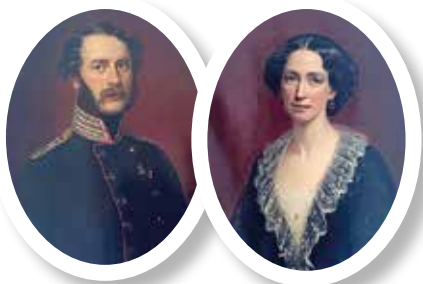
▲ Король Дании Кристиан IX с супругой Луизой Гессен-Кассельской. 1855