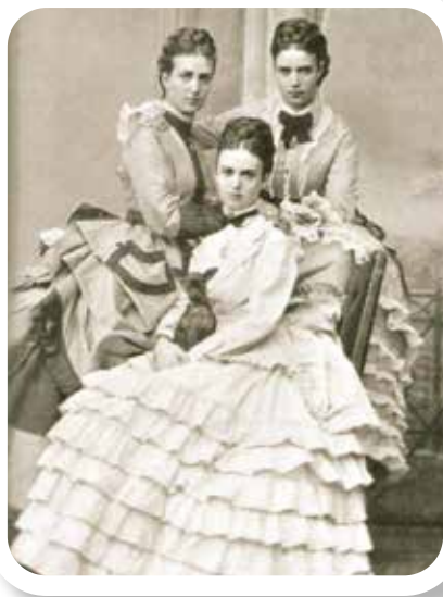
▲ Сестры – Александра, Дагмара (Мария Федоровна) и Тира.

Восьмого ноября на свет появилась дочь Тире – Мария .