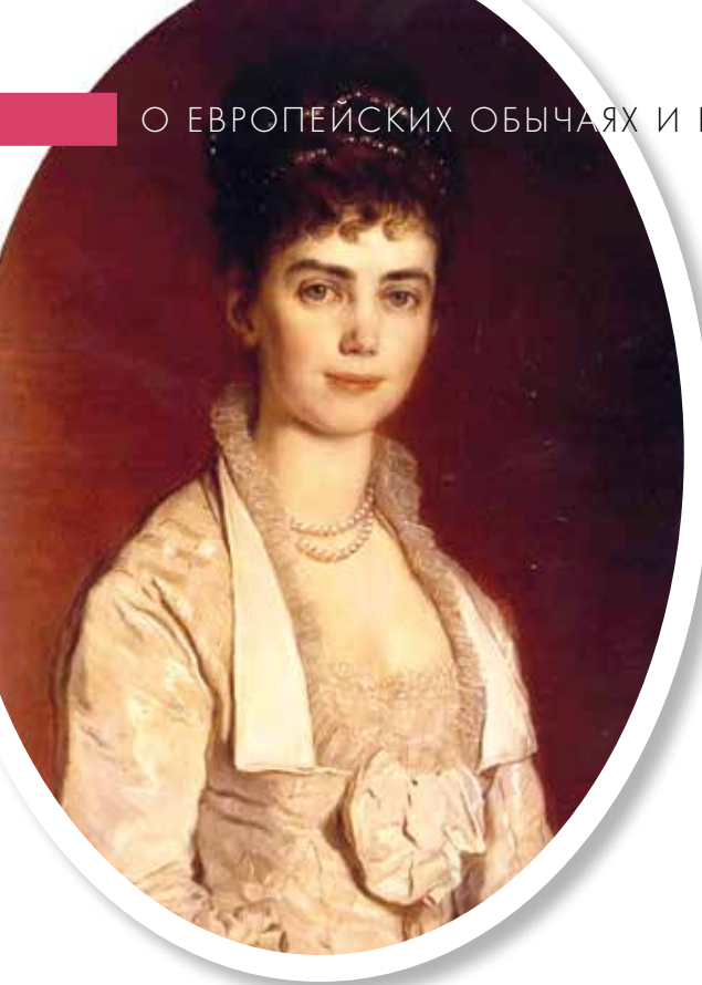
▲ Ти́ра, принцесса Датская.