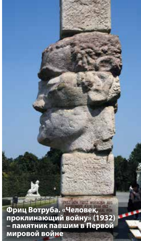
Фриц Вотруба. «Человек, проклинающий войну» (1932) – памятник павшим в Первой мировой войне