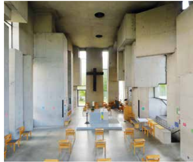
◀ Церковь Троицы на горе Святого Георгия в 23-м районе Вены