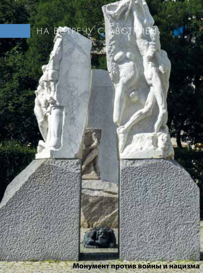
Монумент против войны и нацизма