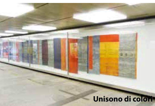
Unisono di colori

Элемент монумента – « Орфей входит в ад ». На этом месте стоял доходный дом, в подвале которого прятались мирные жители. 12 марта 1945 года бомба разрушила здание. Все погибли. Между разломом символических ворот виден старый еврей на коленях, смывающий с асфальта антифашистские ло-