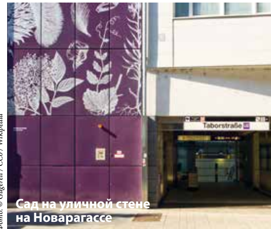
Сад на уличной стене на Новарагассе