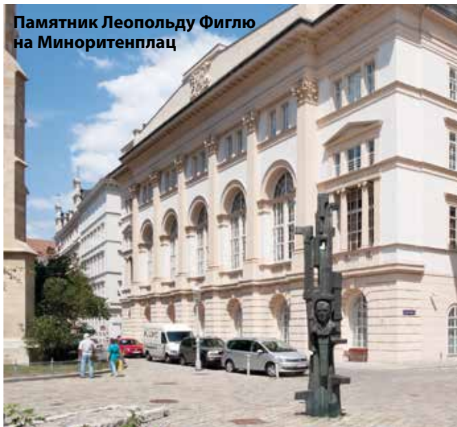
Памятник Леопольду Фиглю на Миноритенплац