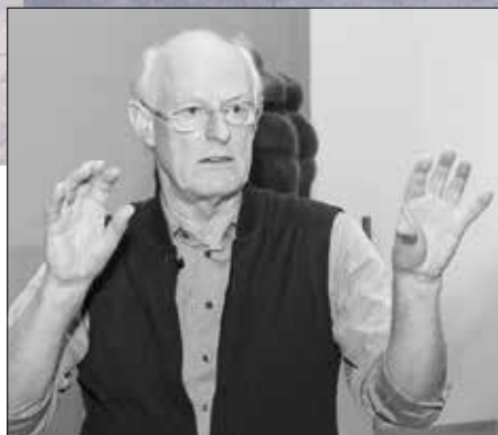
▲ Сэр Тони Крэгг.