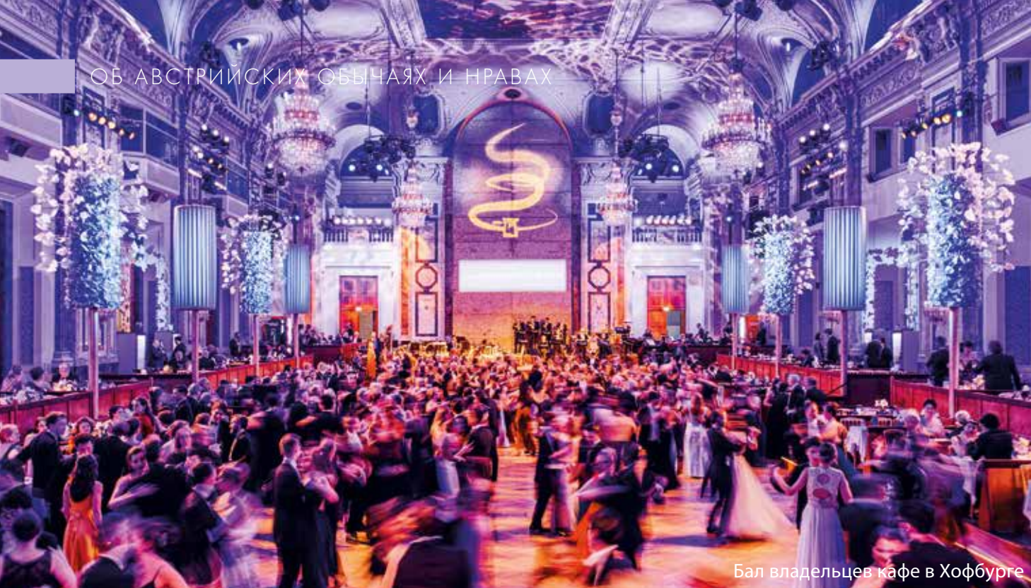
Бал владельцев кафе в Хофбурге