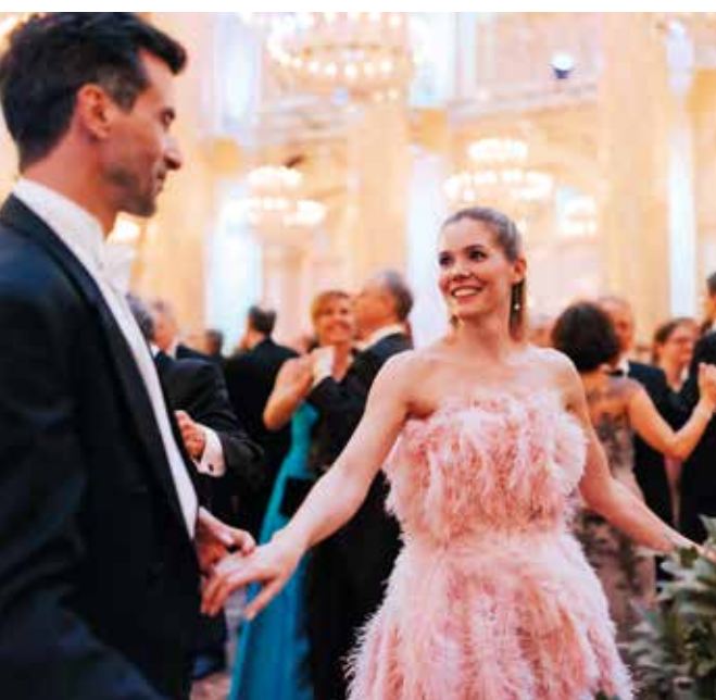
Фото: © WienTourismus / Paul Bauer / Couture Eva Poleschinski

ПОЧЕМУ ТРАДИЦИЯ ВЕНСКИХ БАЛОВ ЕЖЕГОДНО ПРИВЛЕКАЕТ В СТОЛИЦУ АВСТРИИ ГОСТЕЙ ИЗ ДРУГИХ ГОРОДОВ И СТРАН И КАК УДАЛОСЬ ДОСТИЧЬ РЕКОРДНОГО ОБОРОТА В 190 МЛН ЕВРО