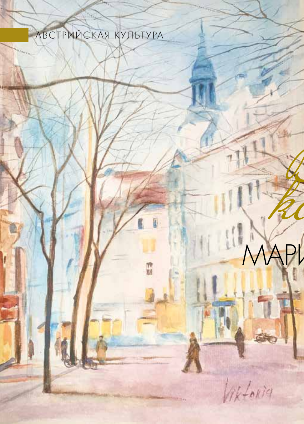
◀ Мариахильферштрассе в Вене, акварель, 21 x 30 см. Виктория Малышева