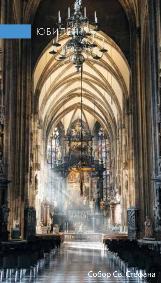
Собор Св. Стефана

Полноби ближнего своего, как самого себя. Иисус Христос из Назарета