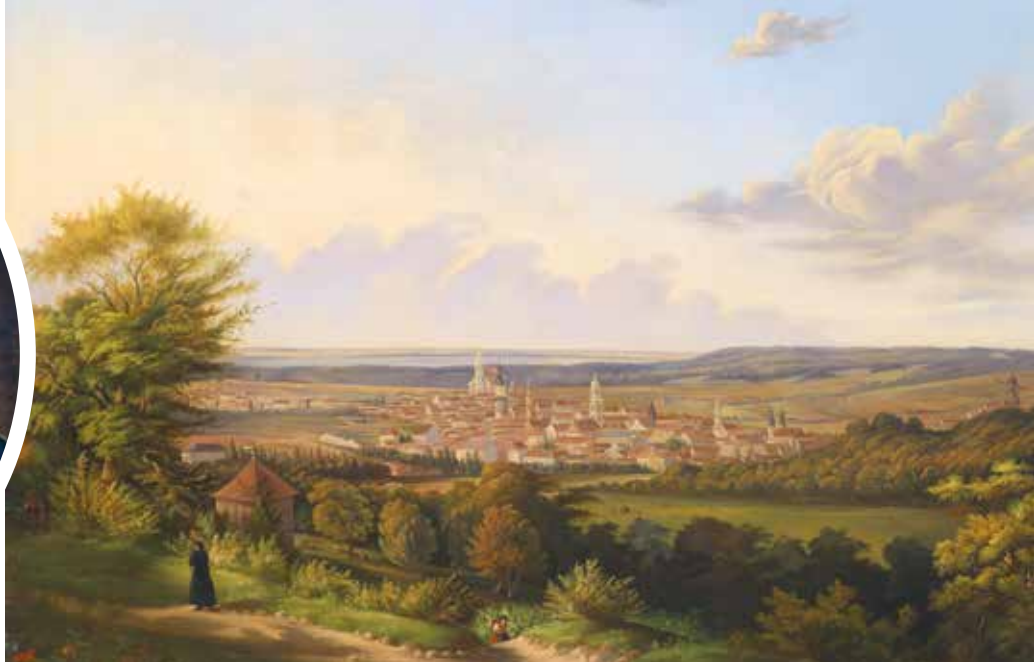
▲ Вид на Шопрон. Г. Хубер, 1865.