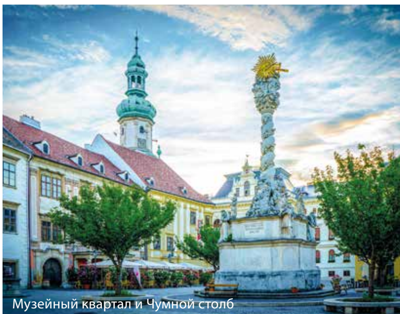
Музейный квартал и Чумной столб