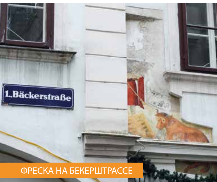
ФРЕСКА НА БЕКЕРШТРАССЕ

Еще одна светская фреска Старого города расположена на Бекерштрассе , но уже снаружи здания. На ней – корова в очках играет с волком в нарды. Предполагается, что около 400 лет назад вся стена дома была расписана такими занятными картинками, намекающими на вечное противостояние католической и реформатской церквей.