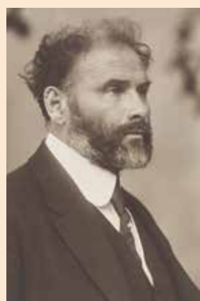
➡ Густав Климт и аллегорическое изображение Медицины.

Фото: Moriz Nähr (Fotograf), Gustav Klimt (1862-1918), Maler, um 1916, Wien Museum Inv.-Nr. 55270, CC0 ( https://sammlung.wienmuseum.at/objekt/436591/ )