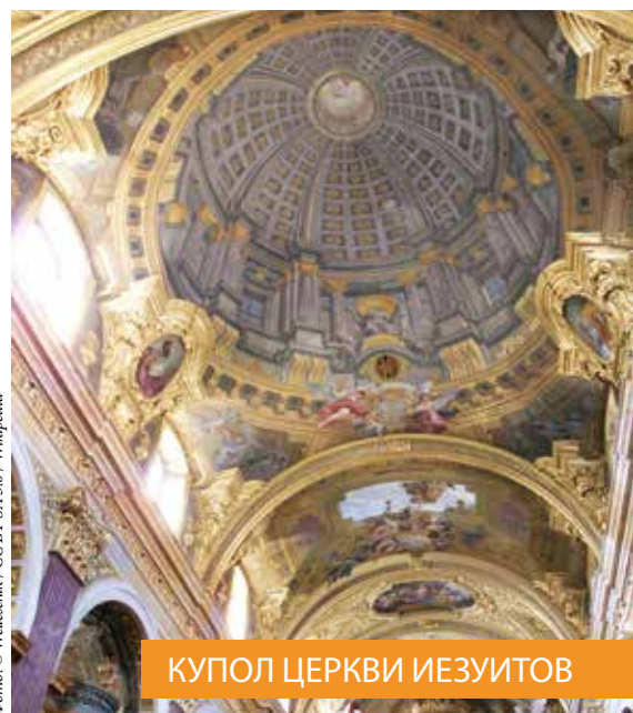
КУПОЛ ЦЕРКВИ ИЕЗУИТОВ