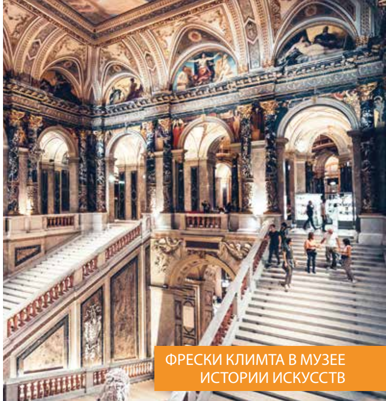
ФРЕСКИ КЛИМТА В МУЗЕЕ ИСТОРИИ ИСКУССТВ

Однако университетская профессура гневно отвергла его труд. Аллегорические изображения Философии , Медицины и Юриспруденции преподаватели назвали порнографией... После скандала, прогремевшего на всю столицу, Густав Климт больше никогда не брал официальных заказов. Университетские панно все же купили; они попали в частное собрание в замке Иммендорф . К сожалению, в 1945 году замок и фрески сгорели.