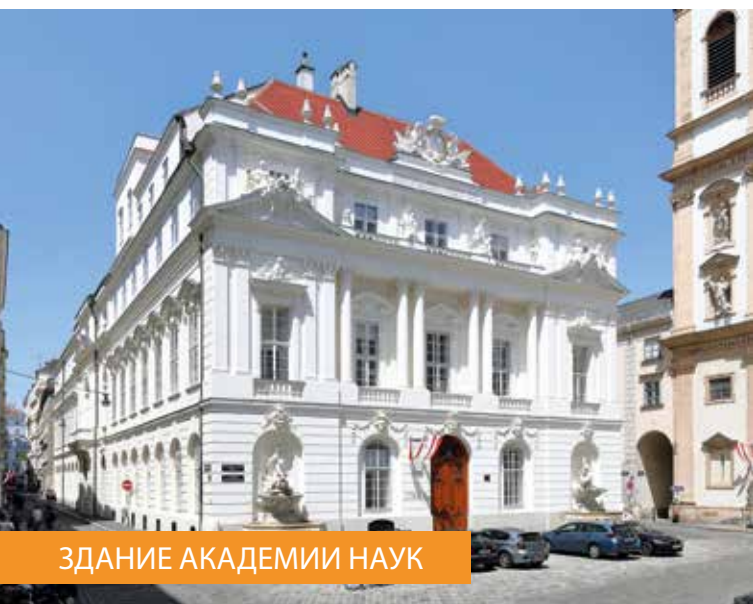
ЗДАНИЕ АКАДЕМИИ НАУК