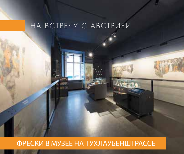
ФРЕСКИ В МУЗЕЕ НА ТУХЛАУБЕНШТРАССЕ