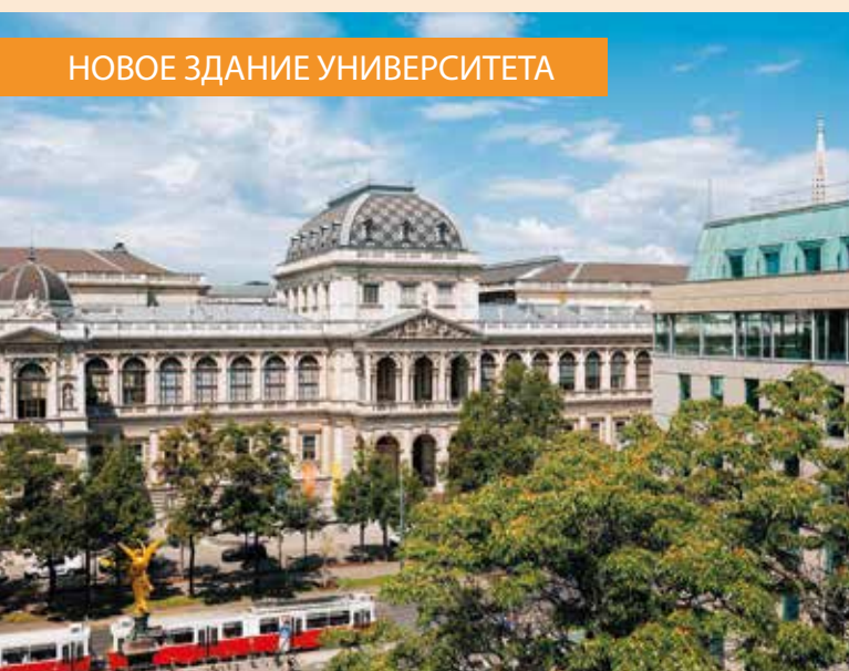
НОВОЕ ЗДАНИЕ УНИВЕРСИТЕТА

В конце XIX века Венский университет переехал в новое здание на строящейся Рингштрассе . Там тоже находятся фрески, судьба которых сложилась странно, несмотря на то, что они были созданы «самым венским художником» – Густавом Климтом . Молодому талантливому мастеру поручили оформить главный зал университета, и работа была завершена в срок.