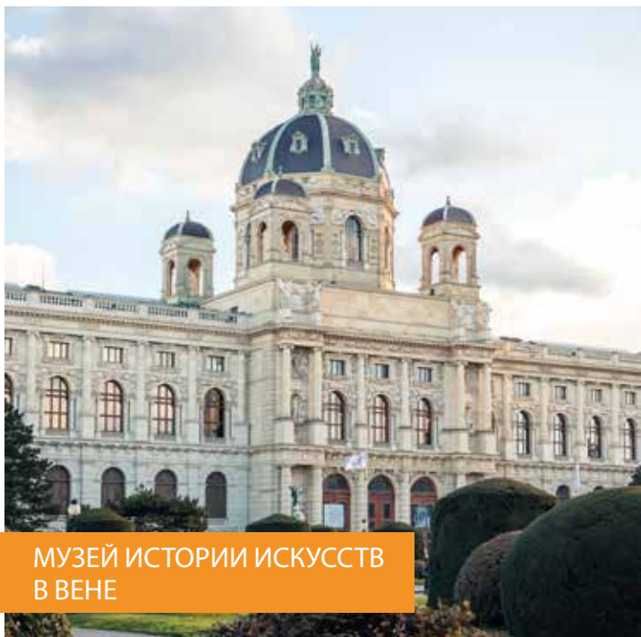
МУЗЕЙ ИСТОРИИ ИСКУССТВ В ВЕНЕ