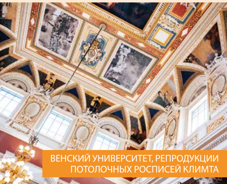
ВЕНСКИЙ УНИВЕРСИТЕТ, РЕПРОДУКЦИИ ПОТОЛОЧНЫХ РОСПИСЕЙ КЛИМТА

ПРОФЕССУРА НАЗВАЛА РАБОТУ КЛИМТА ПОРНОГРАФИЕЙ. ПОСЛЕ СКАНДАЛА, ПРОГРЕМВШЕГО НА ВСЮ СТОЛИЦУ, ГУСТАВ БОЛЬШЕ НИКОГДА НЕ БРАЛ ОФИЦИАЛЬНЫХ ЗАКАЗОВ.