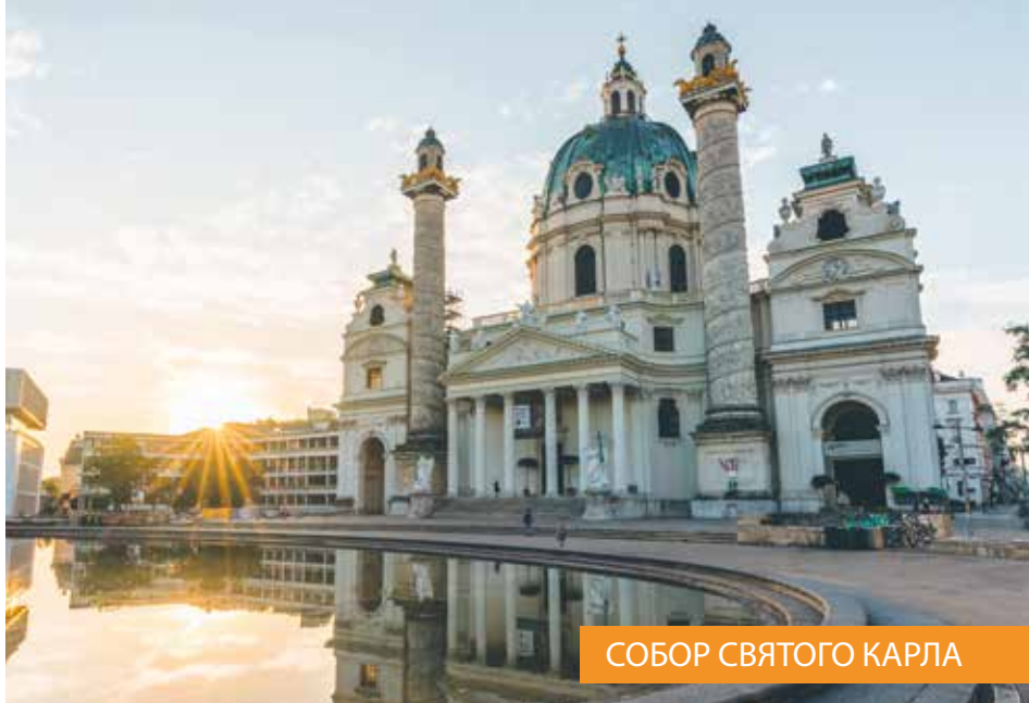
СОБОР СВЯТОГО КАРЛА

размыт, что подчеркивает ускорение всего и всех к небесам.