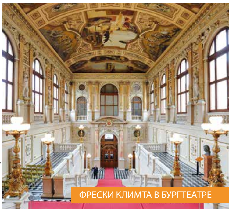
ФРЕСКИ КЛИМТА В БУРГТЕАТРЕ