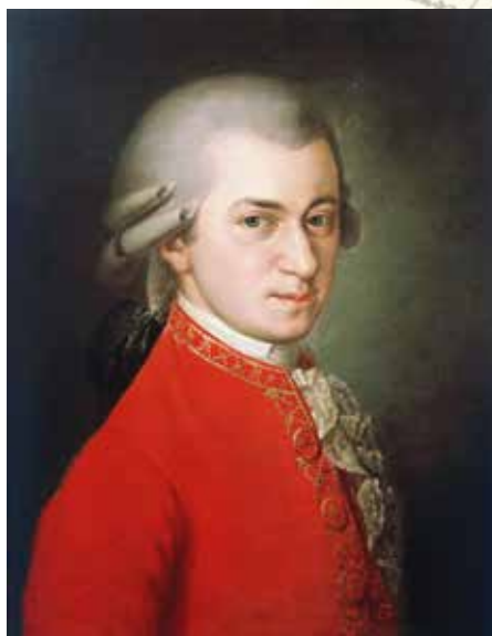
▲ Самый известный портрет Моцарта, написанный посмертно в 1819 году Барбарой Краффт.

«Я не узнаю своего отца ни в одной строке Вашего письма, – писал Вольфганг ему 19 мая 1781 года. – Это, конечно, отец, но это не мой отец».