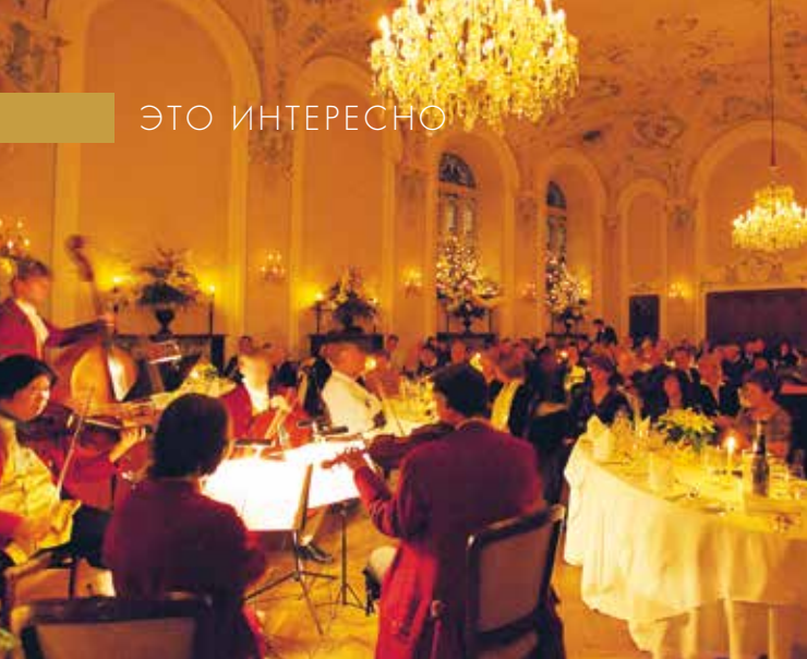
▲ Вечерний концерт «Ужин с Моцартом».