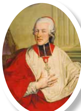
ГРАФ ИЕРОНИМ ФОН КОЛЛОРЕДО