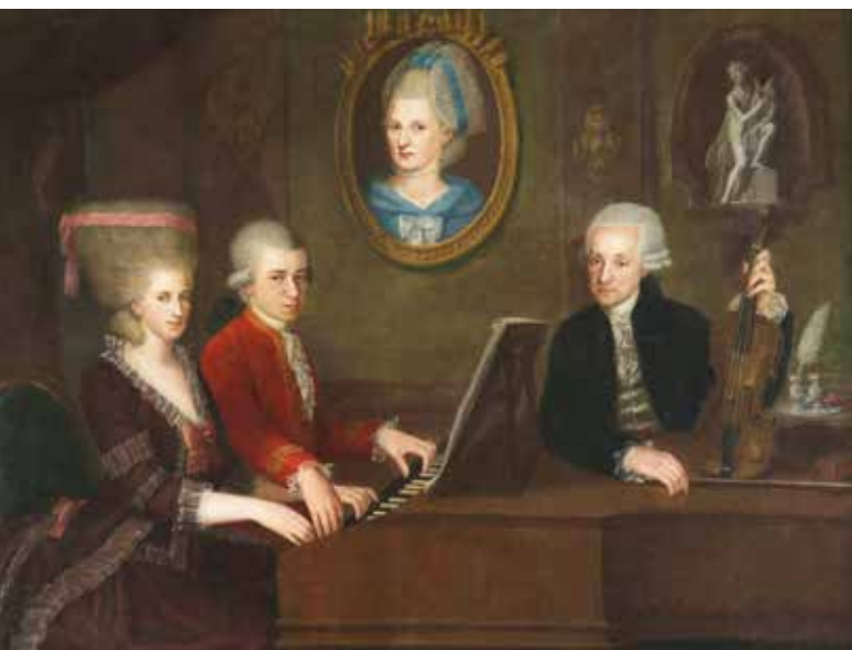
▲ Вольфганг Амадей Моцарт с сестрой Марией Анной и отцом Леопольдом, на стене – портрет его покойной матери, Анны Марии.